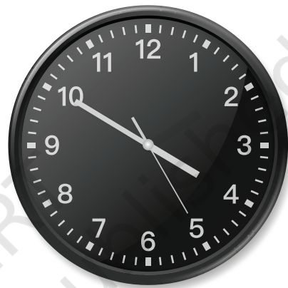
मॉरिशस में घड़ी